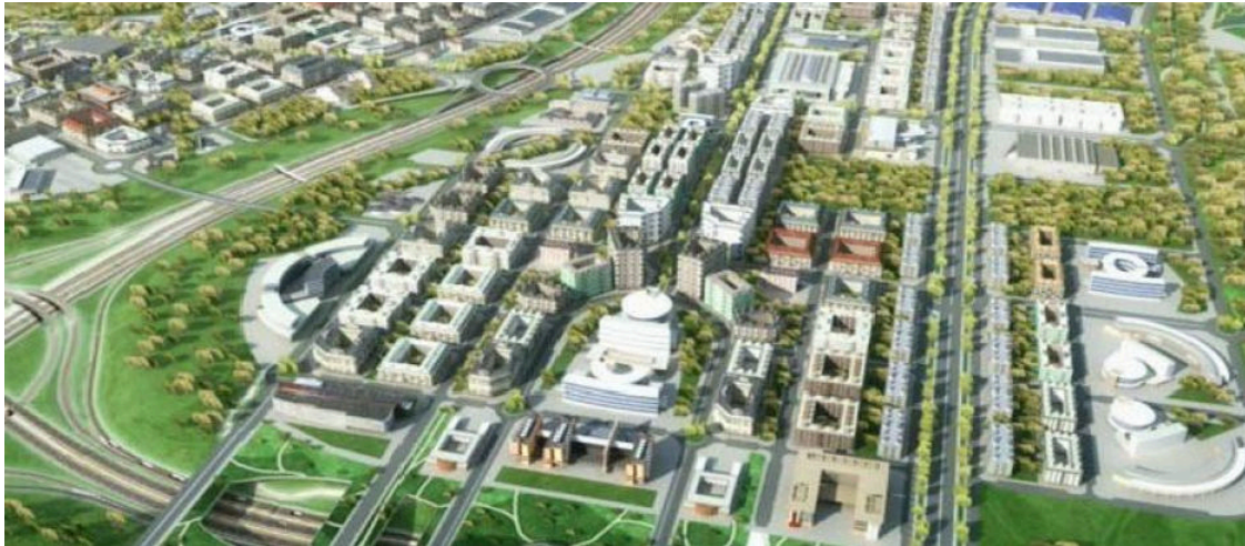
Imagen aérea del proyecto ValdecarrosValdecarros

El nuevo barrio de Valdecarros , ubicado en el suroeste de Madrid, ya tiene sus primeras avenidas y rotondas que organizarán la zona. Esta semana han comenzado los trabajos de urbanización de las etapas 2 y 3 de las ocho que tiene el proyecto urbanístico. La primera de ellas empezó en 2021 y finalizará en marzo de este año. Se prevé que se levanten 51.000 viviendas .