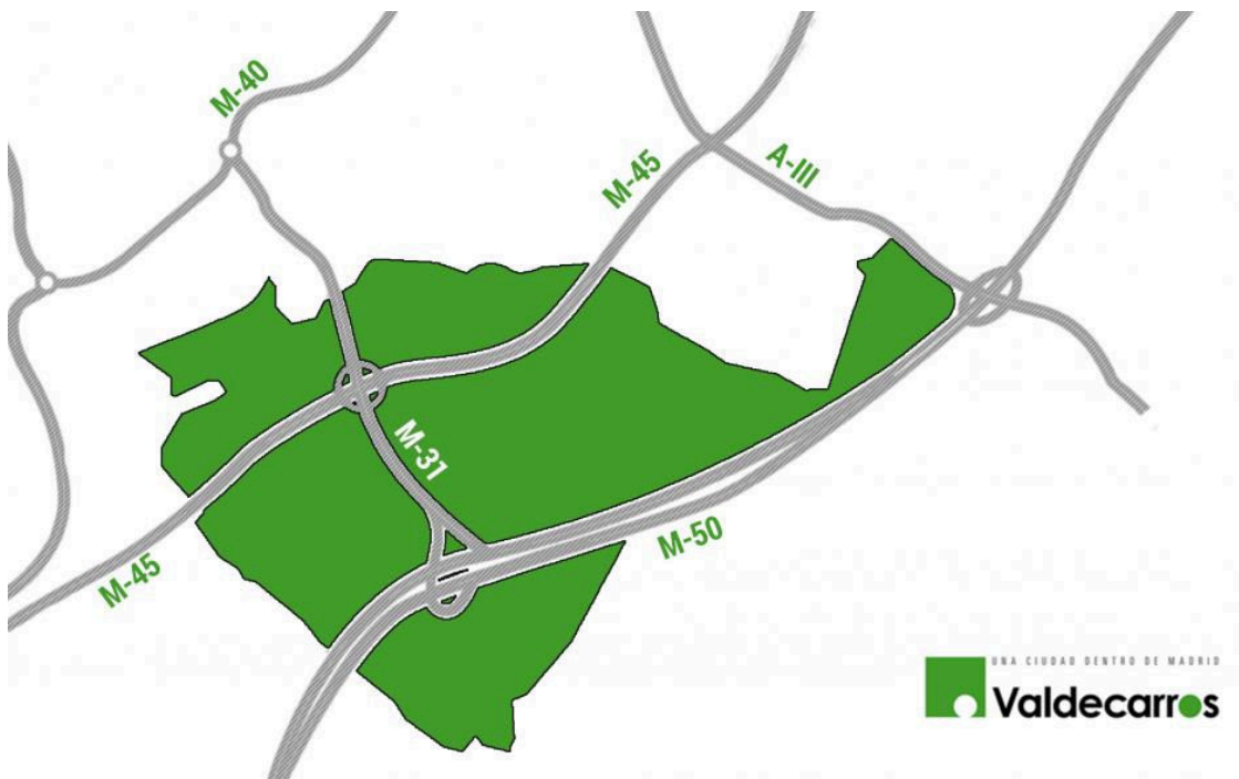
Las conexiones de ValdecarrosValdecarros

Valdecarros contará con una red viaria de 127 kilómetros, que servirá tanto para calzadas peatonales como vías ciclistas. De este modo, se garantizan accesos cómodos y accesibles a las diferentes superficies dotacionales, zonas de esparcimiento y zonas de trabajo.